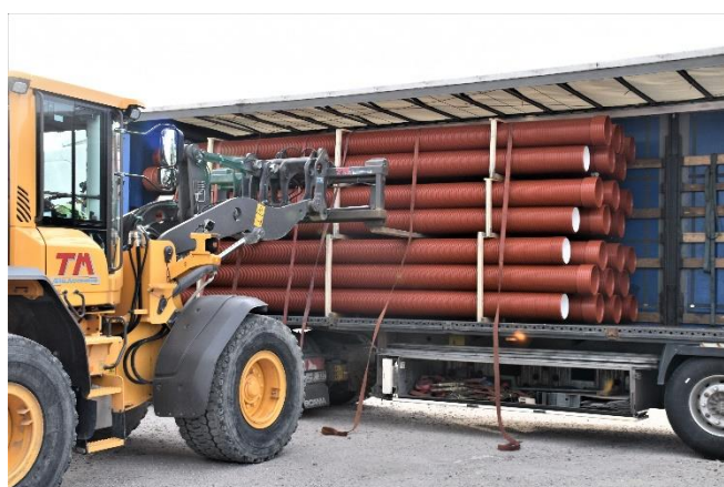
Kuva: Ensimmäinen Ultra Rib 2 Blue –putkitoimitus asiakkaalle Sigtunassa, Ruotsissa.