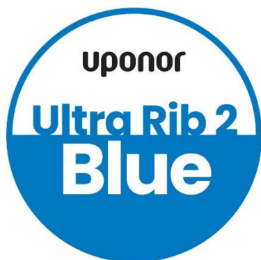
Kuva: Uponorin Ultra Rib 2 Blue logo.