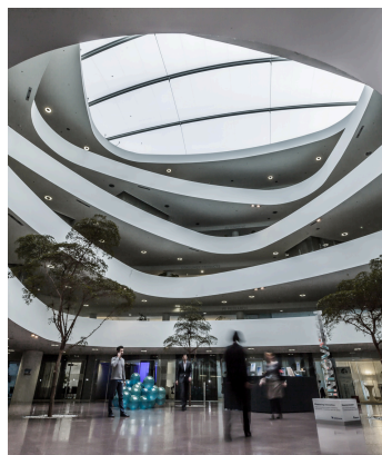
Innovation Headquarters in Linz, Österreich