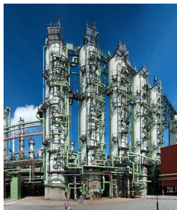
Olefin Produktion in Porvoo, Finnland

Getreu unserem Purpose „Re-inventing essentials for sustainable living“ bauen wir auf unser Bekenntnis zur Sicherheit, auf unsere Mitarbeitenden, auf Innovation und Technologie und auf Exzellenz, während wir den Umstieg auf eine Kreislaufwirtschaft von Polyolefinen beschleunigen und unseren geografischen Fußabdruck für unsere Kund:innen auf der ganzen Welt erweitern.