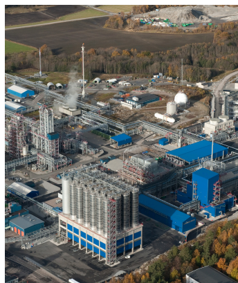
Polyolefin Produktion in Stenungsund, Schweden