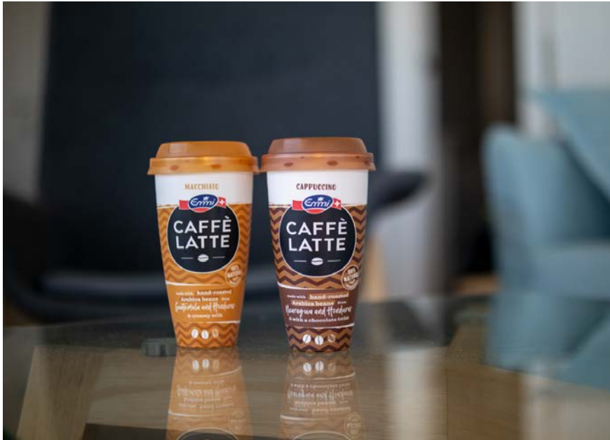
Photo: Mit der Ausrichtung auf recyclingfähige Verpackungen und den Einsatz von recycelten Materialien geht Emmi mit der Erfolgsmarke Emmi CAFFÈ LATTE und in Zusammenarbeit mit Borealis und Greiner Packaging den nächsten großen Schritt.