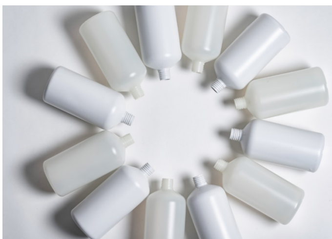
Foto: Die Anlage für mechanisches Recycling wird auf der Borealis-eigenen Borcycle™ M-Technologie beruhen, die polyolefinbasierte Post-Verbraucher-Abfälle in Hochleistungspolymere für anspruchsvolle Anwendungen umwandelt.